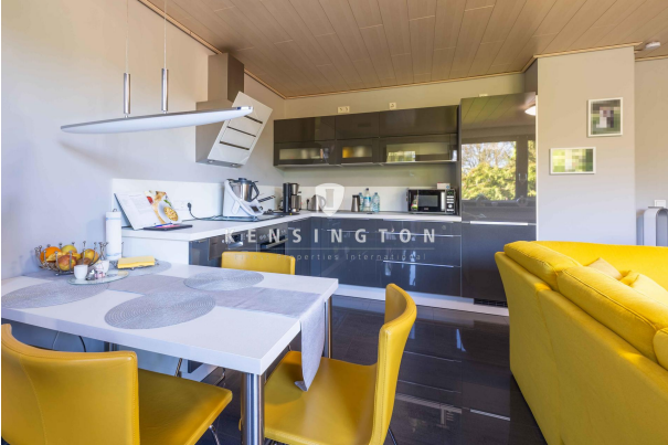
Zimmer 1/ Küche