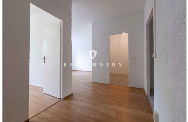
Blick zur Küche