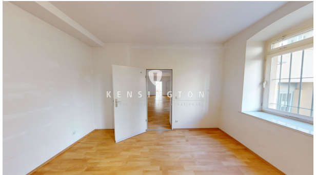
Zimmer zum Hinterhof