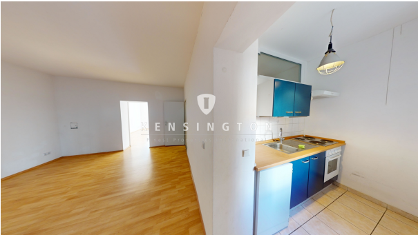
Blick in die Küche